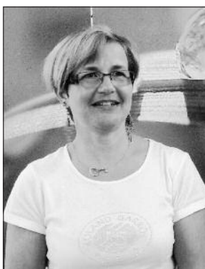
Wir sprechen: Deutsch, Englisch, Italienisch, Französisch

Anmeldungen sind schriftlich per E-Mail oder Post an uns zu richten.